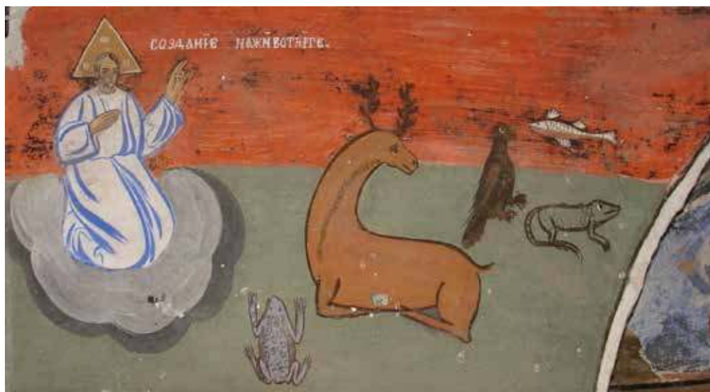
Фиг. 2. Храм „Св. Петка“ в с. Чуйпелъово. Бог Отец дава имена на животните