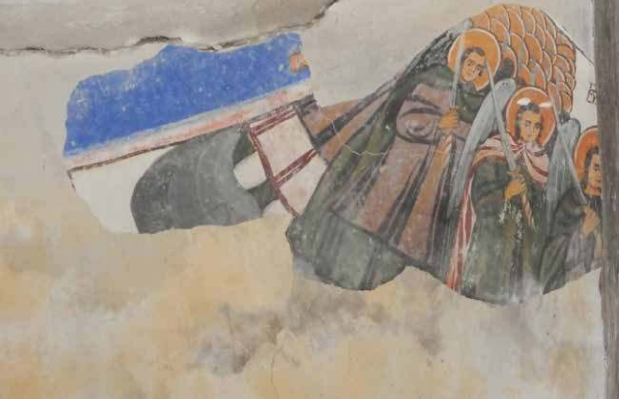
Фиг. 1. Храм „Св. св. Петър и Павел“ в с. Доспей. Небесно войнство. Фрагмент