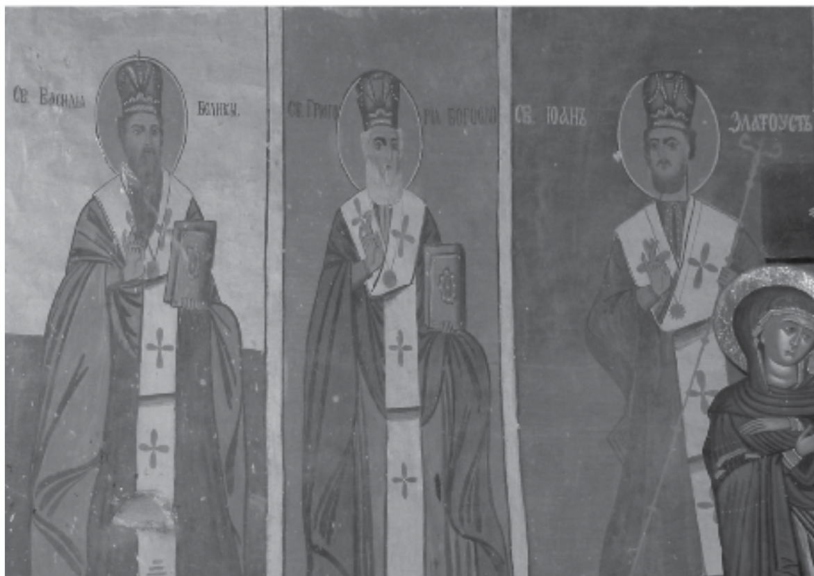
Фиг. 6. Храм „Св. св. Кирил и Методий“ (Св. Крал) Люлински манастир. Отпите литургисти: св. Василий Велики, св. Григорий Богослов и св. Иоан Златоуст

то ще остане в София – град, много по-назад от Самоков, Русе или Търново, и при изселването на турците, макар и да е разполагал със значителни средства, закупил имоти в Самоков, а не в София. Димитър Антикар умира на 89-годишна възраст на 1 октомври 1904 г. Връщайки се от млекарницата, бил нападнат от градския бик, който му счупил ребра, което става причина за смъртта му според семейната хроника 15 .