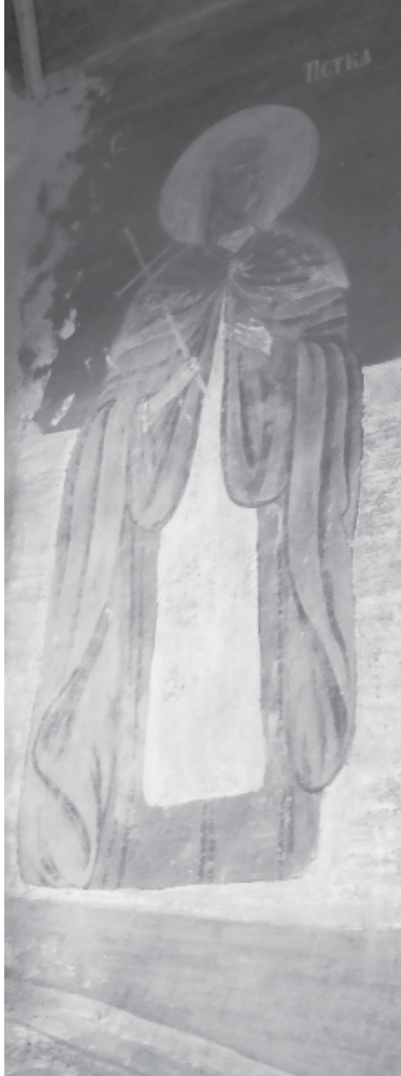
Фиг. 10. Храм „Успение Богородично“ в гр. Бобошево. Св. Петка