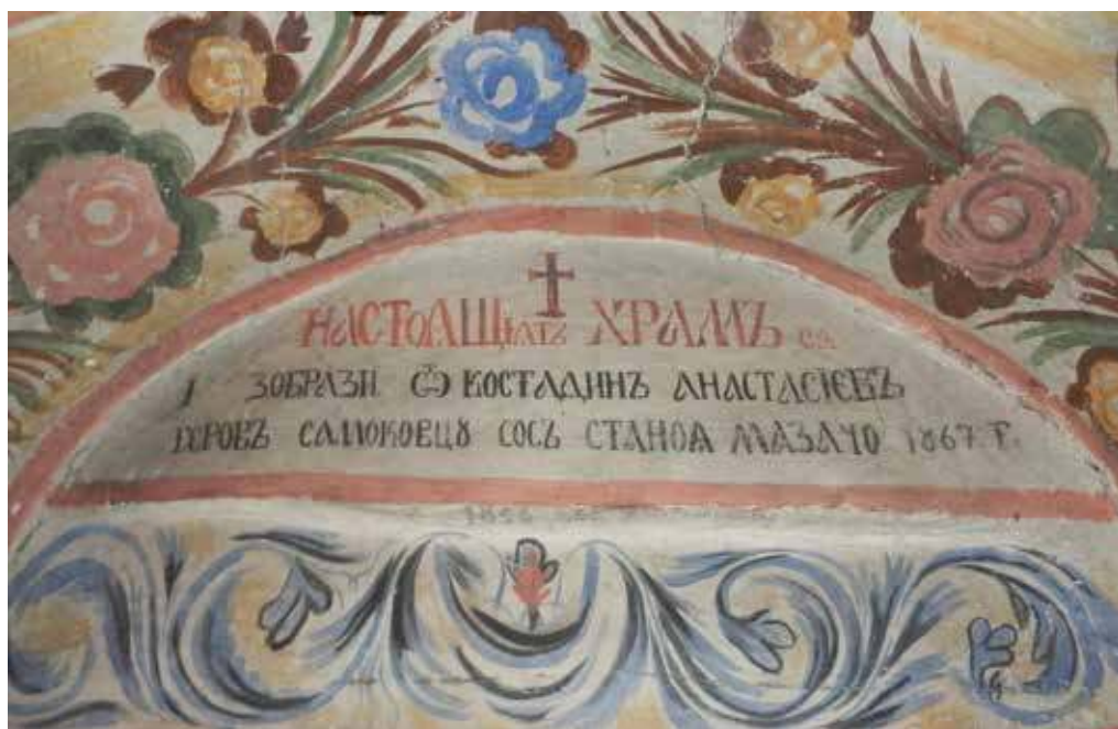
Фиг. 3. Храм „Св. св. Петър и Павел“ в с. Кралев дол. Възпоменателен надпис