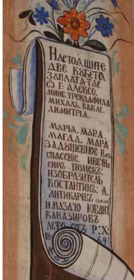
Фиг. 5. Храм „Св. арх. Михаил“ в с. Студена. Възпоменателен надпис