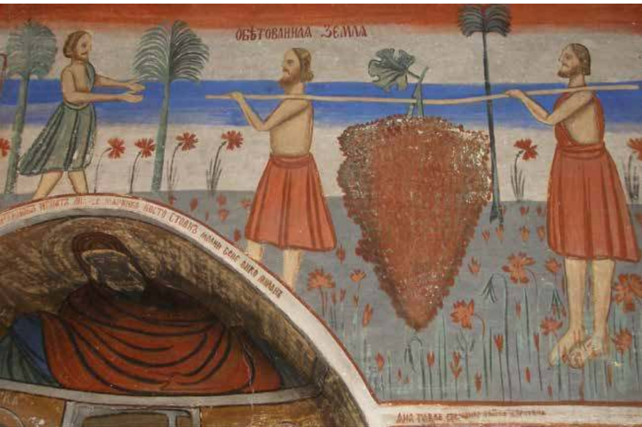
Фиг. 7. Храм „Св. Николай“ в Кладнишкия манастир. Обетованата земя