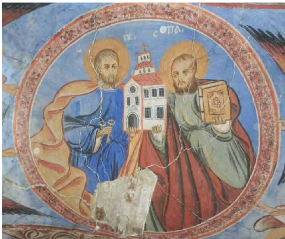
Фиг. 4. Храм „Св. св. Петър и Павел“ в с. Кралев дол. Св. св. Петър и Павел – патрони на храма

тър Антикар е изработвал и венчални пръстени за заможните жители на Самоков. Сред клиентите си Антикарят имал както християни, така и мюсюлмани, вторите си носели скъпоценни и подускъпоценни камъни, закупени от Мека по време на хаджилъка. Най-предпочитаният материал бил ахатът (акът камик) 13 . Поръчките очевидно са били много, а и добре платени. Майсторът антикар е изработвал по 7-8 по-прости антики на ден, а от по-сложните – по 3-4 на ден. Заплащало се от 10 до 20 гроша според големината и сложността на антиката.