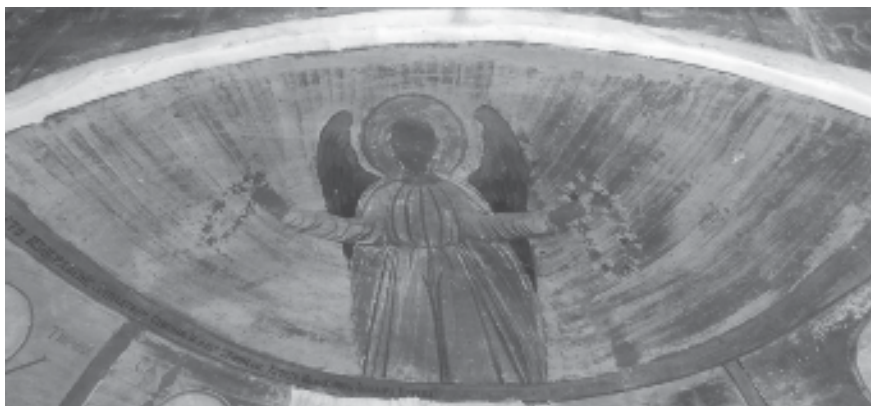
Фиг. 8. Храм „Св. Николай“ в кв. Църква, Перник. Ангел

хора от Самоков. След Освобождението учи в Санкт Петербург. Заради заслугите му в Сръбско-българската война през 1886 г. получава капитански чин, майор от 1888 г., а през 1909 г. е награден с медал „За независимостта на България 1908“.